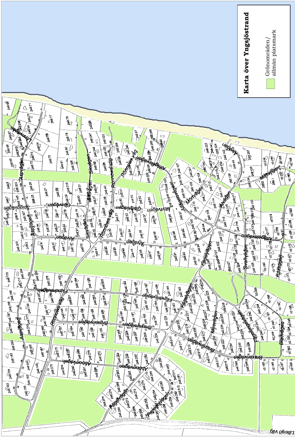
Karta över Yngsjöstrand Grönområden/ allmän platsmark